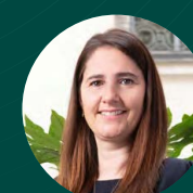
ALICE GORGE Private Wealth Management, France

« Dans le domaine des technologies d'information, nous veillons à concevoir des solutions durables porteuses de valeur ajoutée dans les nouvelles technologies, la data et les outils digitaux. »