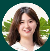
GU YANXIU Asset Management, France

« Déceler au quotidien les meilleures opportunités d'investissement dans les portefeuilles obligataires High Yield que nous gérons chez ODDO BHF, constitue chaque jour un challenge très excitant pour les équipes. »